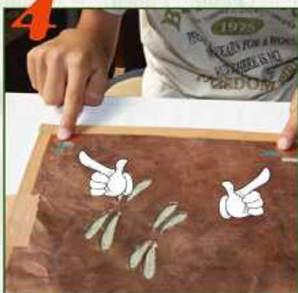
1枚目の型を目印に合わせてテープで固定します