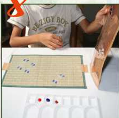
1枚目の型を塗り終わったら2枚目の型に交換します