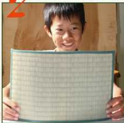
さあ、製作スタート!