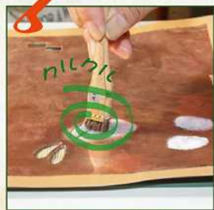
ハケをクルクル回すように塗ります