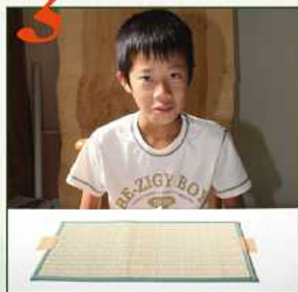
最初にい草のマットをテープで固定します