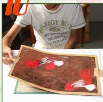
2枚目の型を交換します