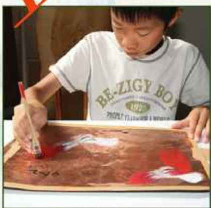
1枚目の型と同様の手順で色を重ねていきます