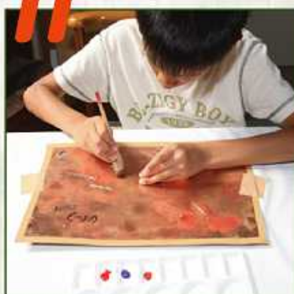
3枚目の型で色を重ねていきます