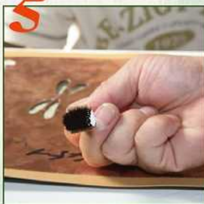
専用のハケに少しだけ絵の具をつけます