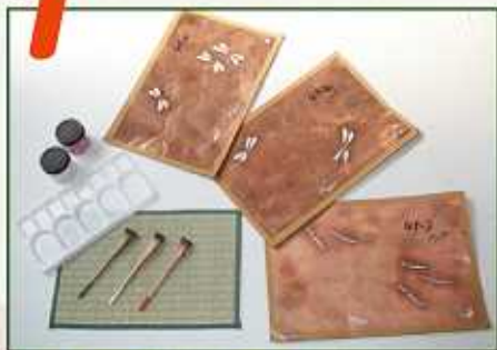
実際に使用する道具