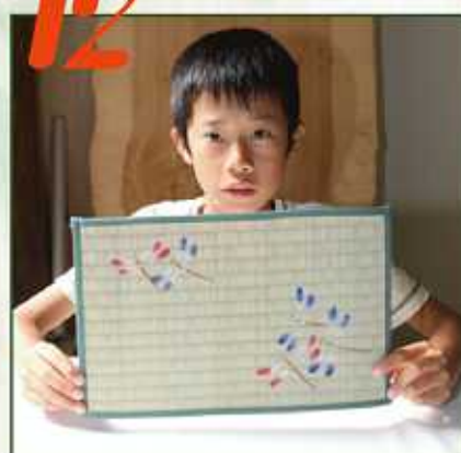
素敵なテーブルセンターの完成♪